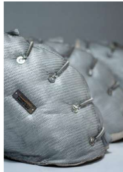
Ilustración 3: Capa exterior con malla