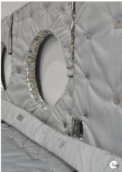
Ilustración 1: Capa Interior de Foil

Las configuraciones de las Chaquetas Aislantes Removibles se dan de acuerdo a las necesidades específicas de cada cliente, encontramos: