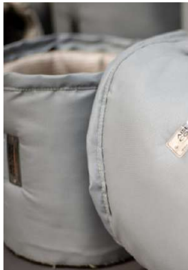
Ilustración 2: Capa interior de tela sílice y malla